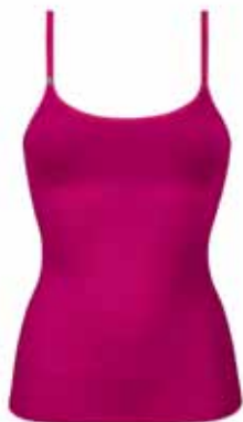
TRENDY SENSATION Alakformáló trikó

Ruha alatt észrevehetetlen, karcsúsító body körkötött anyagból.