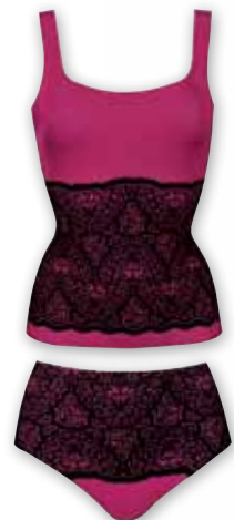
VELVET SENSATION Alakformáló trikó és Hipster String

Nőies színek, bájos díszítőelemekkel, melyek nemcsak öltöztetnek, de érzékien formáznak is.