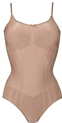
RETRO SENSATION Body

Igéző, alakformáló, has tájékra fókuszáló trikó és magasított hipster-string bársony díszítéssel.